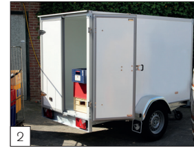
Option: Einachsige Kühlwagen bis 1800 kg ZGG, Maße bis maximal 300 x 150 x 210 cm.