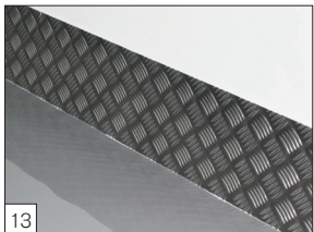
Option: spezielle selbstnivellierende Beschichtung auf dem Boden und Schutzleisten aus Aluminium.