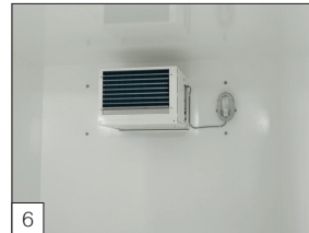
Serienausstattung: Kühlteil auf der Innenseite einschließlich Innenbeleuchtung.