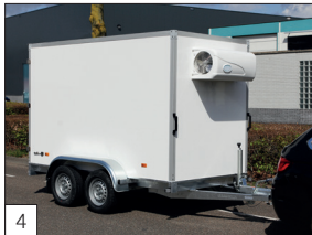
Option: Doppelachsige Kühlwagen bis 3500 kg ZGG, Maße bis maximal 400 x 180 x 210 cm.