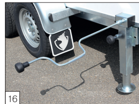
Option: solide Kurbelstützen (drehbar und einstellbar) einschließlich Kurbel.