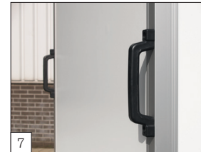
Serienausstattung: 2 Handgriffe an der Vorderseite.