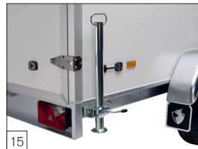
Option: Schiebestützen montiert.