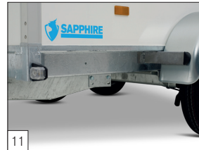
Serienausstattung: Kotflügelträger zur Befestigung von Kotflügeln montiert.