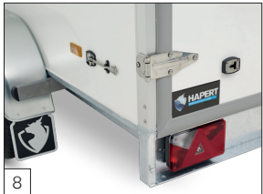
Serienausstattung: Scharniere und Befestigungsmaterial aus Edelstahl.