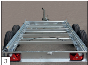
Serienausstattung: Verschweißtes oder im Vollbad verzinktes Fahrgestell für Tandemachser.