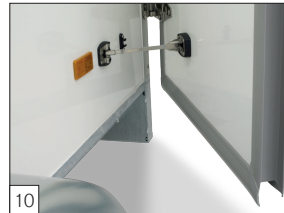
Serienausstattung: isolierte Türen 40 mm dick, mit Gelcoat versehen.