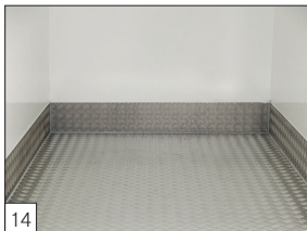
Option: Aluminiumriffelblech und Schutzleiste montiert.