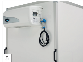
Serienausstattung: Kühlaggregat 230/50 Hz mit einer Leistung von 1600 W/2 °C an der verstärkten Vorderseite einschließlich Verlängerungskabel.