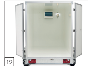
Serienausstattung: Wände mit Gelcoat, Dach und Boden 40 mm isoliert.