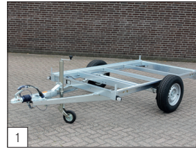
Serienausstattung: verschweißtes und im Vollbad verzinktes Fahrgestell für Einachser.