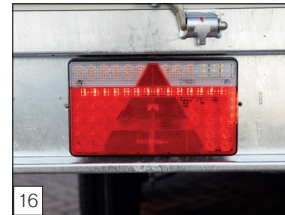
Option: LED-Beleuchtung (nicht möglich bei 144 cm breit)