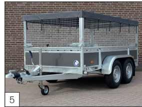
Option: Gitter-Aufsatz 700 mm hoch (abnehmbar) und ein engmaschiges Ladungsnetz (montiert).