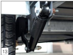
Option: Stoßdämpfer an der (den) Achse(n) montiert.