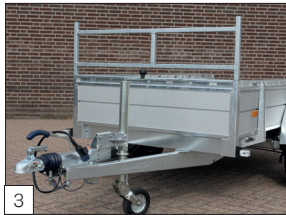
Serienausstattung: herausnehmbares Frontgitter.