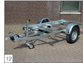
Option: Modell L-1 „Chassis“ lieferbar in gebremster und ungebremster Ausführung.