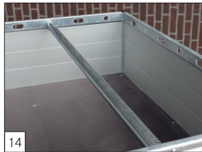
Option: Sperrstange montiert.