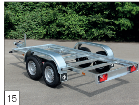
Option: Modell L-2 „Chassis“, als zusätzliche Option ist u.a. Eine Multiplex-Bodenplatte möglich.