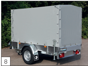
Option: Plane montiert, verschiedene Höhen möglich mit Stützfüßen inkl. Schiebeklemme montiert.