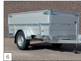
Option: abnehmbare Aluminium-Aufsatzbordwände ca. 40 cm hoch, mit robusten Verschlüssen.