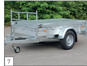
Option: flache Abdeckplane montiert (Farbe grau).