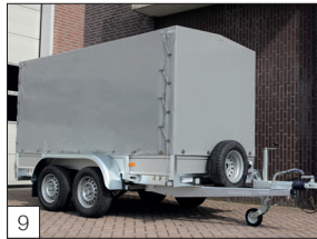
Option: Plane montiert und Ersatzrad mit Stütze an der Vorderseite.