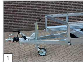
Serienausstattung: robustes Fahrwerk, die für alle einachsigen Versionen bis einschließlich 1800 kg Zulässiges Gesamt Gewicht geeignet ist.