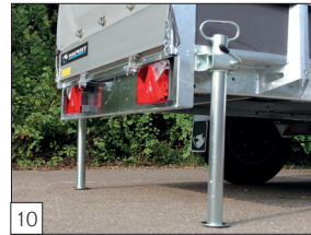
Option: Schiebestützfüße mit Klemmbügel montiert.