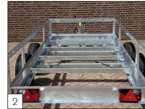
Serienausstattung: vollverschweißte und verzinkte Rahmen, die für alle Tandemachs-Versionen bis 3500 kg Zulässiges Gesamt Gewicht geeignet ist.