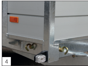
Option: Schraubhaken an der Außenseite.